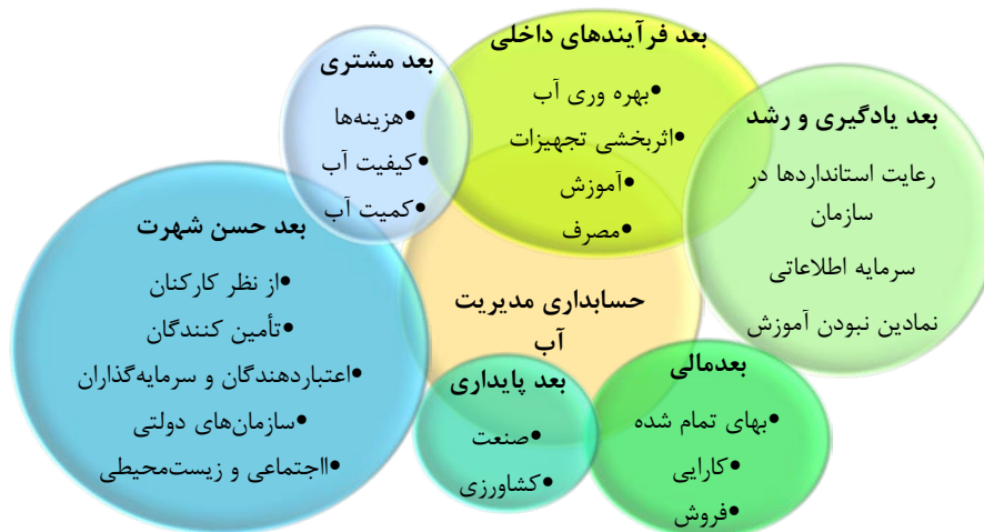
شکل ۱. الگوی مفهومی حسابداری مدیریت آب در ایران

الگوی مفهومی پژوهش بر اساس نتایج حاصل از کدگذاری متن‌ها و با استفاده از روش تحلیل تم، تدوین و در شکل ۱ ارائه شده است.